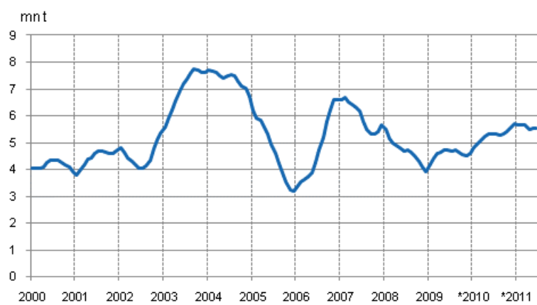
Figurbilaga 1. Stenkolsförbrukning, glidande summa för 12 månader